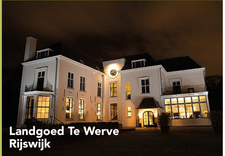
Landgoed Te Werve Rijswijk