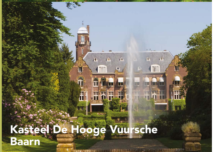
Kasteel De Hooge Vuursche Baarn