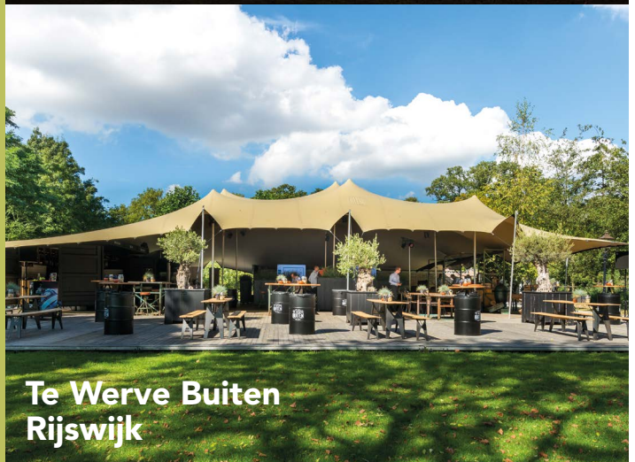
Te Werve Buiten Rijswijk