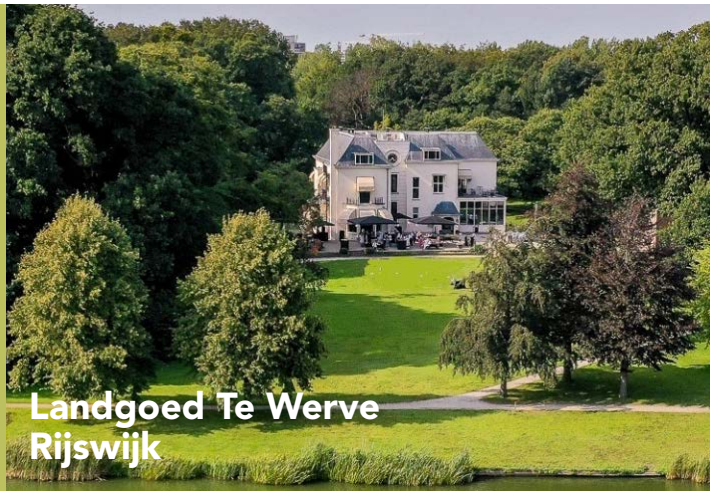
Landgoed Te Werve Rijswijk

Bijgaand enkele suggesties voor de invulling van jullie bijeenkomst. Om een goede indruk van onze locatie te krijgen nodigen wij je graag uit voor een rondleiding. Bel voor een afspraak 070-41 52 185. Voor een eerste indruk verwijzen wij je graag naar: www.tewerve.nl/zakelijk/